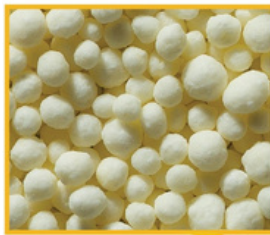
YaraVera™ AMIDAS (Mieszanina chemiczna)