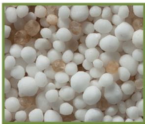
Inne nawozy (Mieszanek/Blendy)